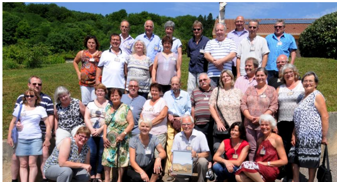
Entre les deux villages, c'est l'entente cordiale.

Accueil le samedi matin salle Michel-Simonin, la délégation a pris un repas en commun avec ses hôtes puis une escapade à Nancy était au programme avec la visite de la vieille ville, le guide n'étant autre