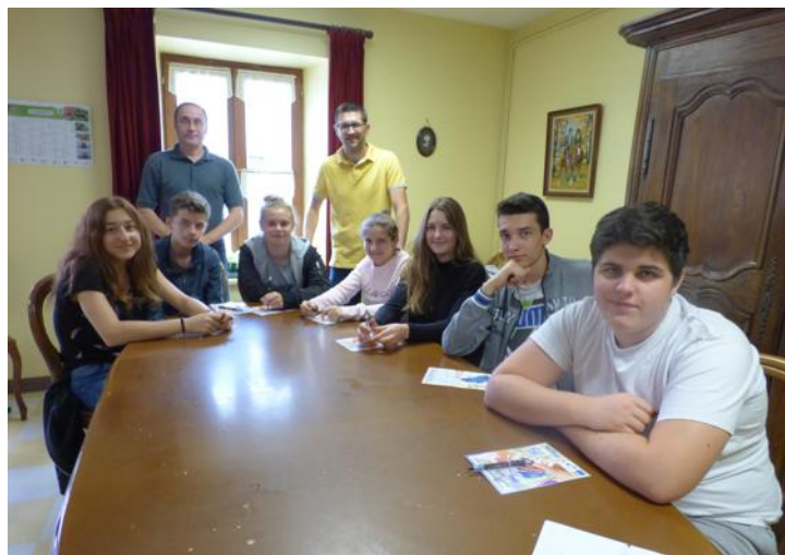
Des choses bonnes à savoir pour une future recherche d'emploi.

Cette année, douze jeunes du village nés en 2000-2001 sont accueillis depuis le 10 juillet dans le cadre du « chantier jeunes » organisé par la municipalité.